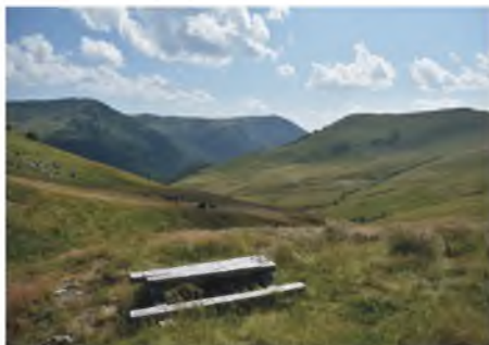
Iznad vrela Vrbasa

Jedne subote neznajući šta ćemo odsebe i kud ćemo, Mufa i ja, metodom slučajnog 'mapovskog uzorkovanja' odaberemo ovaj kraj za prohodati planinom. Namjerno ne kažem planinariti, jer nismo planinarili, više je to od planinarenja. Uzmemo za cilj katun Gvoždanske staje i izvor Vrbasa. Na ovaj i susjedne katune su izlazili sa stokom