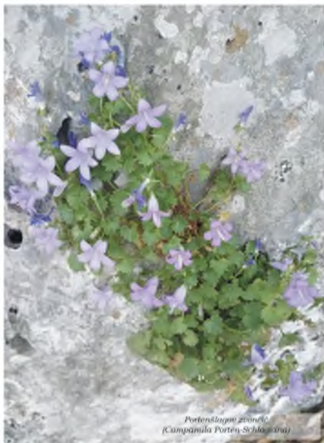
Portenslagovog zvončića (Campanula Portenslagoviana)

ulaznica za turističku pećinu, nego piše da je za adrenalinski park. Ispred pećine fino urađen i uređen parking prostor, kapija urađena propisno da ne ometa ulaz i izlaz šišmiša (u unutrašnjosti ih nismo opazili, iako nam je ljubazna teta dala lampe da ih pokušamo uočiti), informativna tabla o arheološkim iskapanjima... No, nažalost nema nikakve informacije da su ispred pećine ili na cijeloj lokaciji Peć Mlina mogu naći ova dva endema ili bilo koje druge biljne vrste, a Peć Mlini kao uža lokacija su navedeni da su u rasprostranjenosti Portenslagovog zvončića.