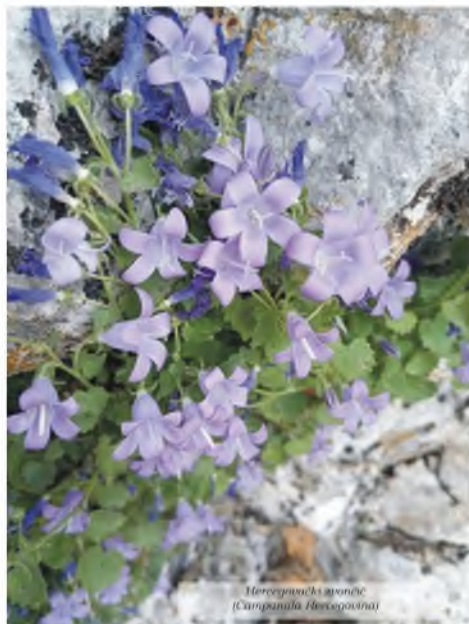
Hercegovacki zvončić (Campanula Hercegovinai)