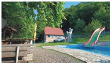
Paraglajding klub na Ozrenu

U dolasku smo pregledali vikendicu u selu Donji Lug kod Žepča i ovaj put potvrdili