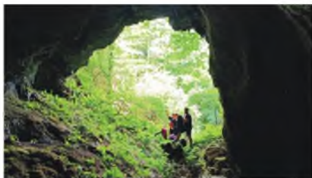
Ulaz u Suhu Megaru