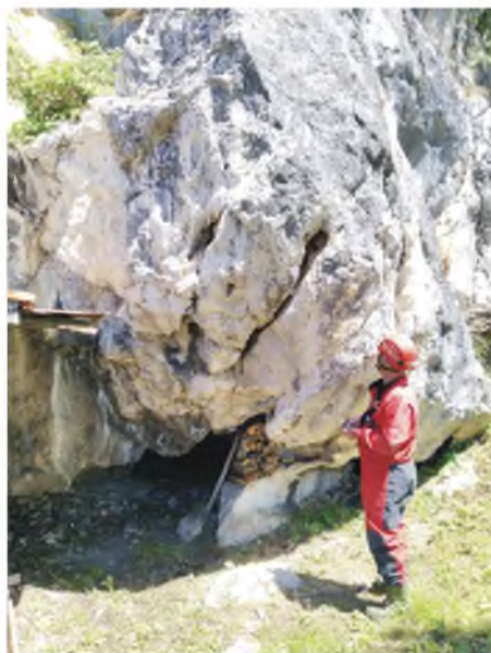
Pećina Zakrš u Milankovićima