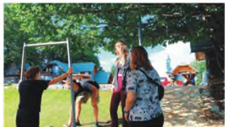
Montaža "štoka" buduće harfe