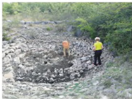
Lokva kod Mrkonjića

zanimljivog domaćina, dugogodišnjeg pomorca. Kod Grmljana smo obišli veliku cisternu za vodu (dimenzije 15 x 7 m) i estavelu Bezdán koja je bila suha. Za obilazak nekoliko bezimernih estavela sljedeći put treba ponijeti mačete i ma-