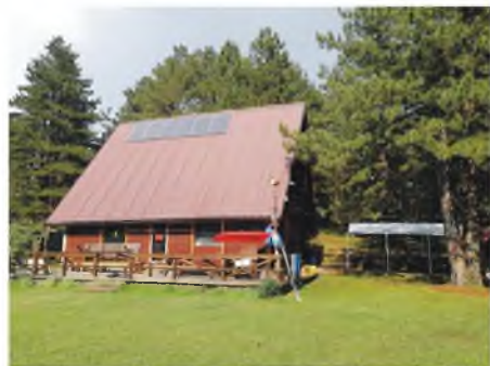
Planinarski dom "Matinski vis"

Na Zvijezdi smo uzeli uzorke kod korita prema Strici, a onda na Zelenom viru rijeke Bioštica. Potom na Drežanki ispod restorana, iz rijeke Ljute i sa nekoiko vrela okolo, iznad vodopada na Plivi i sa jezera Modrac i na kraju sa česme kod sela Seljani (opština Rogatica).