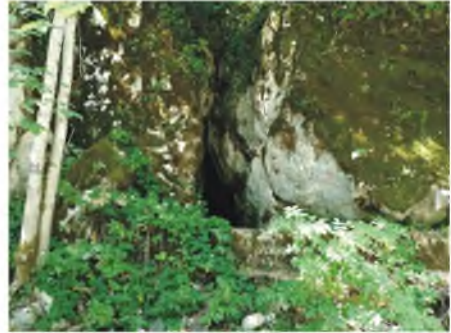
Pećina u Suhoj