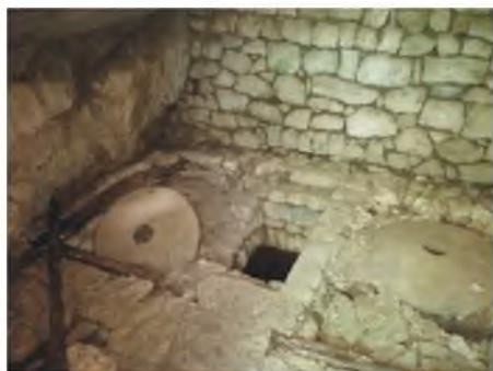
Mlin kod Grmljana