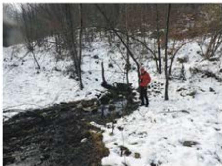
(Vrelo u Trbušnici, Tajan)