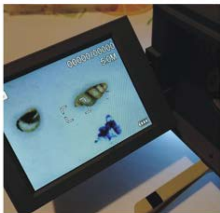
(Hydrobidae iz pećine Izvorište u Mahmutovića rijeci, Ilijaš - za orijentaciju veličine puževa širina kista je 7 mm; bijela tačka na kistu je također puž)

Pećine na Tajanu i Konjuhu su i dio pregleđa ova dva područja u budućoj mreži Natura 2000, koje radimo u okviru projekta financiran od strane Fonda za zaštitu okoliša FBiH.