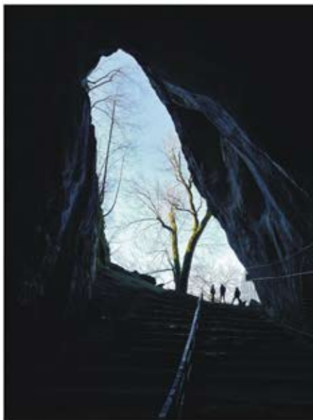
(Brateljevička/Djevojačka pećina, Konjuh)

Na Konjuhu smo posjetili Bebravu pećinu, gdje smo zabilježili 6 vrsta i našli kosti još dvije, zatim Vrelo pećinu u koju smo ušli samo nekoliko metara radi visoke vode, Pećinu na raskršću, Djevojačku pećinu i pećinu Kućaru.