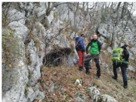
(Henića pećina iznad staze, Konjuh)

Na Konjuhu smo posjetili Bebravu pećinu, gdje smo zabilježili 6 vrsta i našli kosti još dvije, zatim Vrelo pećinu u koju smo ušli samo nekoliko metara radi visoke vode, Pećinu na raskršću, Djevojačku pećinu i pećinu Kućaru.