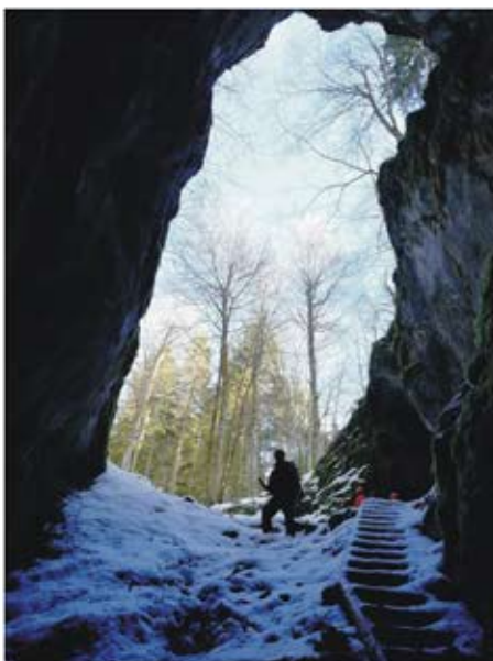
(Bebrava pećina, Konjuh)