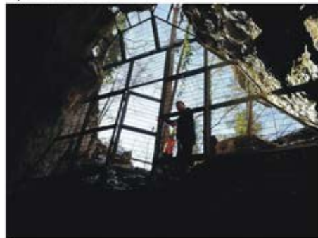
(Pećina u Srednjoj stijeni, Tajan)