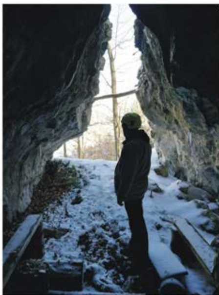
(Pećina Zaklon, Tajan)

Na Tajanu smo posjetili pećine u Srednjoj stijeni: Zaklon, Ugao, Pećinu pod kamenim mostom, Bivak i Pećinu u Srednjoj stijeni. U ovu zadnju su se naselili mali potkavasti šišmiši, a ponovo je pregledano tlo i nađeno više raspadnutih gvala sove (koja je potpuno istrijebila velike mišouhe šišmiše i večernje šišmiše prije nekoliko godina). Vrijeme nam nije dozvoljavalo da detaljnije pregledamo ostatke gvala, pa će to biti jedan od prioriteta za vrijeme istraživačkog kampa na Tajanu u avgustu ove godine. Zanimljiv je i nalaz ostatka nekadašnje pećine na putu za pećinu Zaklon, a također ostaci pećine koji se vide u napuštenom lokalnom kamenolomu u Trbušnici. Nadam se da će biti vremena i snaga da malo pregledamo i sedimente iz ove dvije stare pećine. U pećini Zaklon smo naišli i na tragove zlatnog šakala, i o tome objavili bilješku u Lovačkom listu . Iz vrela u Trbušnici i kod jezera na Mašici smo sakupili uzorke vodenih puževa Hydrobidae .