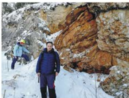
(Ostaci nekadašnje pećine, Srenja stijena, Tajan)