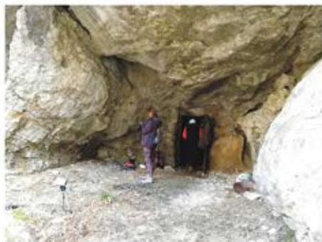
(Pećina Izvorište u Mahmutovića rijeci, Ilijaš)