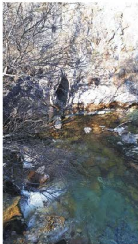
Ulaz u Pećinu ispod Mušenice